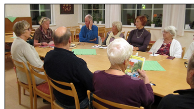
Samtal om böcker och litteratur.