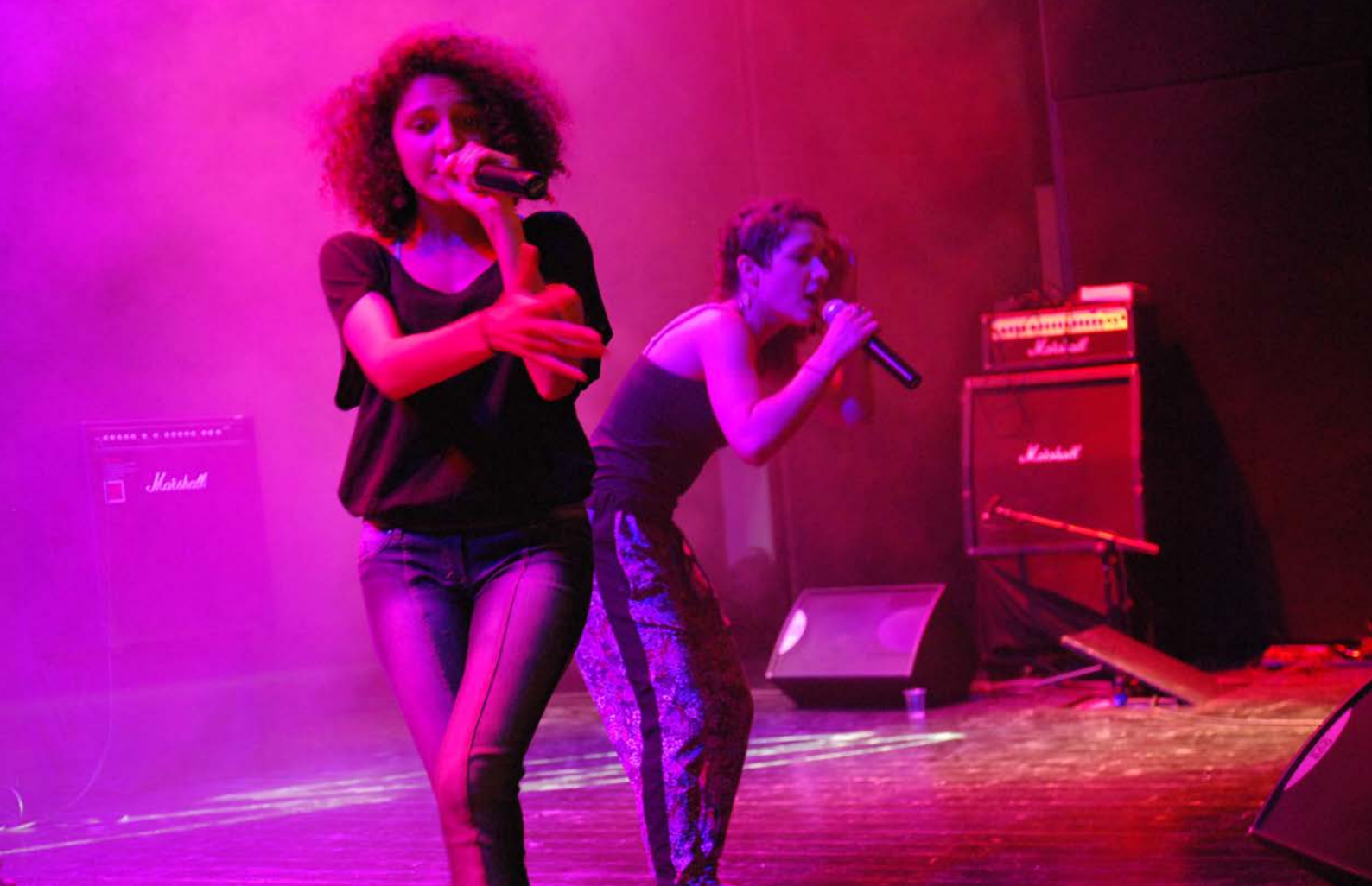
Foto: Dmar (Amande Tartour & Mai Zarkawi) på Bildas Kulturfestival Dandanat i Betlehem.