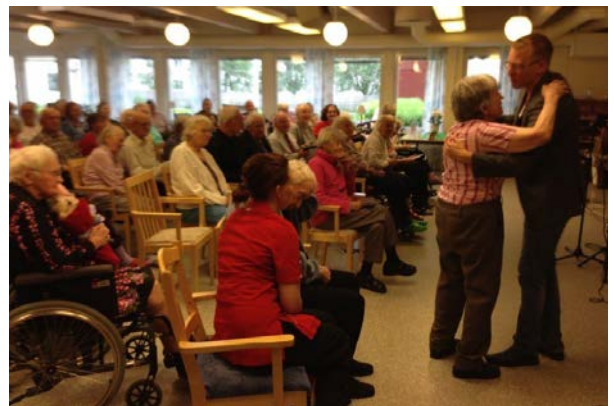
Foto: Musikunderhållning Wesslandia.