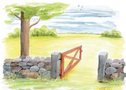
Foto: Inbjudan till föreläsningen, När minnet sviktar en föreläsning som arrangerades av SV och Tierps Bibliotek.

ABF har haft verksamhet med omkring 50 asylsökande i svenska och samhällskunskap på Älby Herrgård. Ett arbete som fortsätter under 2016.