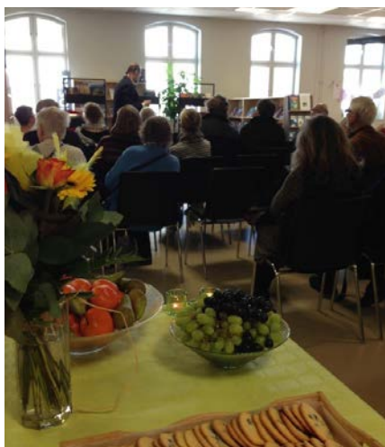
Foto: NBV samarbetar varje år med Konst på väg, en jurybedömd konstrunda som pågår i Tierps kommun under fyra dagar. På bilden syns invigningen av Konst på väg. Foto Birgitta Nordqvist.