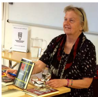
Foto: Bokcafé med Litteraturföreningen i samarbete med Studieförbundet Vuxenskolan.

På de här sidorna vill vi berätta om vad vi i Studieförbunden har gjort i Östhammar under 2015 och vad vi har på gång 2016.