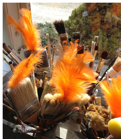
NBV genomför Konstssommar på Gräsö under 2017.

Under året fokuserade ABF på att ge asylsökande möjligheter att lära sig det svenska språket. Språk är en avgörande faktor för att kunna ta sig fram i samhället och för att bättre kunna ta vara på sina rättigheter. Svenskundervisningen i Östhammars kommun genomfördes främst i studiecirkelform på asylboenden.