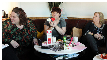
Studiecirkelverksamhet hos ABF i Gimo.

Totalt deltog 250 personer i någon av Studieförbundets litteraturverksamheter vilket kan jämföras med de 70-tal som deltog 2015. Under året har det genomförts författarbesök, poesievenemang och skrivarcirklar exempelvis Poesi på olika språk den 17 mars på Glenn Millers restaurang samt två Sommarlitteraturkaféer den 12 och 15 juli i Equmeniakyrkan.