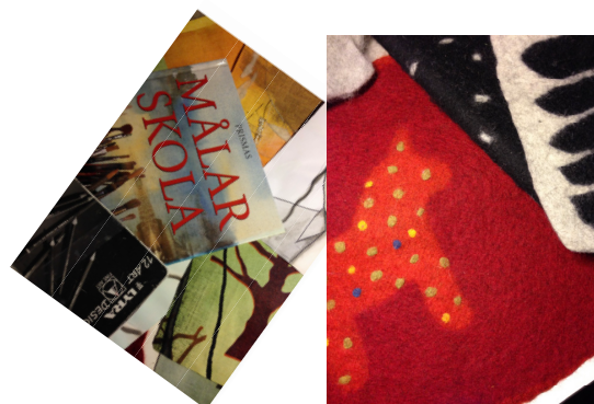
Textil- och bildskapandehos NBV, Tierp.

bakning och naturkunskap. På äldreboenden har flera cirklar i Minnen från förr hållits, med allt från minnen från skolåren till upplevelser av berättelser kring folktro och skrock i bygden. Nysvenska grupper har genomförts i Körkortsteori, svenska, föreningskunskap, sömnad och hantverk med mera. Dessutom har flera cirklar hållits i musik, dans, bygdehistoria, konst och hantverk, litteratur med mera