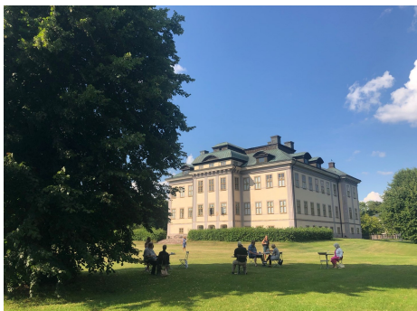
Konstkurser utomhus och med Coronadistans, vid Salsta slott.